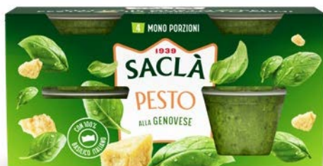
PESTO ALLA GENOVESE 4XME