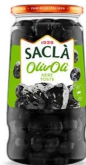
OLIVE NERE TOSTE