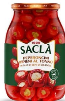
PEPERONCINI RIPIENI AL TONNO