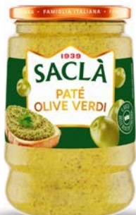
PATÈ OLIVE VERDI