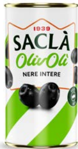
OLIVE NERE INTERE