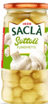
FUNGHETTI MAXI FORMATO