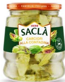
CARCIOFI ALLA CONTADINA