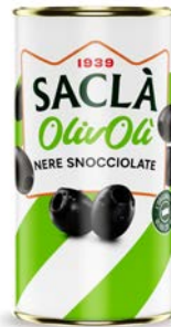
OLIVE NERE SNOCCIOLATE