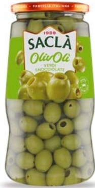
OLIVE VERDI SNOCCIOLATE