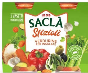
VERDURINE PER INSALATE DUO