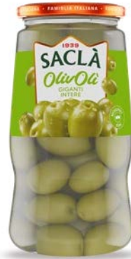
OLIVE GIGANTI INTERE