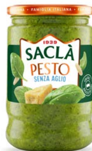
PESTO ALLA GENOVESE SENZA AGLIO