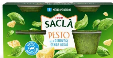
PESTO ALLA GENOVESE SENZA AGLIO 4XME