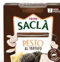
PESTO AL TARTUFO 2XME