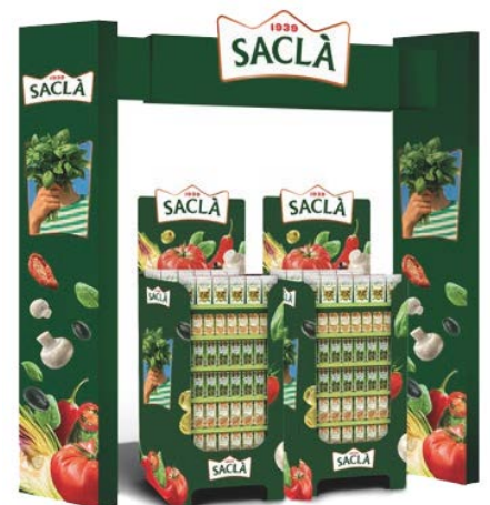
ARCHROLL COD. DREBNO0700001

Larghezza 1,21 m Lunghezza 0,81 m Altezza 0,55 m