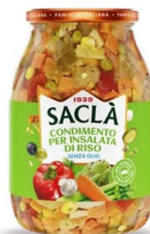
CONDIMENTO RISO SENZA OLIO