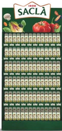
CROWNER TESTATA COD. DREBNO0700000

Larghezza 1,10 - 1,33 m Lunghezza 0,57 m Altezza 0,50 m