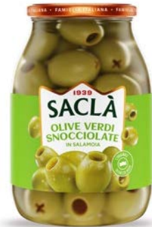
OLIVE VERDI SNOCCIOLATE