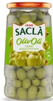
OLIVE VERDI SNOCCIOLATE