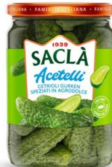
CETRIOLI GURKEN IN AGRODOLCE