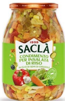
CONDIMENTO RISO CLASSICO