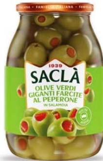
OLIVE VERDI GIGANTI FARCITE AL PEPERONE