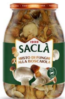
MISTO FUNGHI ALLA BOSCAIOLA