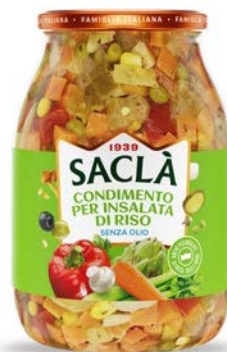
CONDIMENTO RISO SENZA OLIO