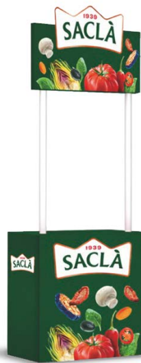
PROMOTER DESK COD. DREBNO0700003

Larghezza 1,10 - 1,33 m Lunghezza 0,57 m Altezza 0,50 m