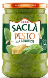
PESTO ALLA GENOVESE