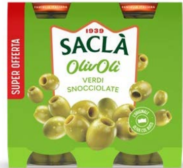
OLIVE VERDI SNOCCIOLATE DUO