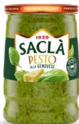
PESTO ALLA GENOVESE