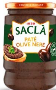
PATÈ OLIVE NERE