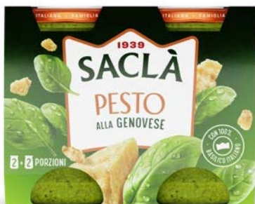
PESTO ALLA GENOVESE DUO