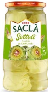
CUORI DI CARCIOFO