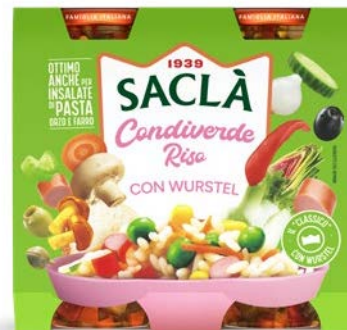
CON WURSTEL DUO