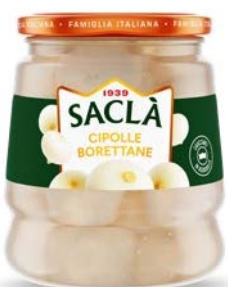
CIPOLLE BORETTANE IN AGRODOLCE