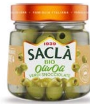
OLIVE VERDI SNOCCIOLATE BIO