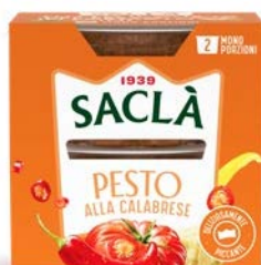
PESTO ALLA CALABRESE 2XME