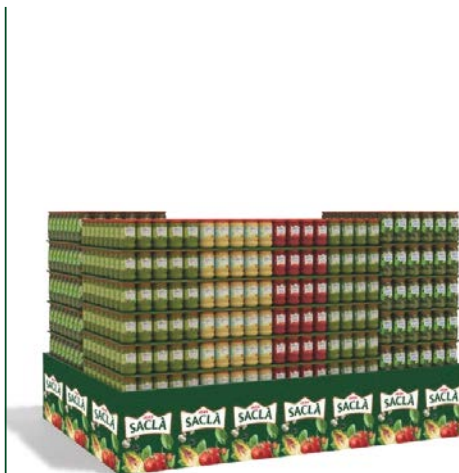
COPRI PALLET COD. DREBNO0700002

Larghezza 0,80 m Lunghezza 0,53 m Altezza 2,27 m