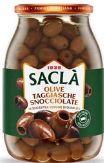
OLIVE TAGGIASCHE SNOCCIOLATE IN OLIO EXTRA VERGINE DI OLIVA