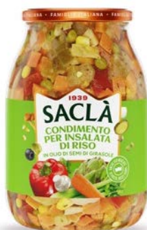
CONDIMENTO RISO IN OLIO