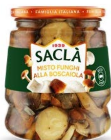
MISTO FUNGHI ALLA BOSCAIOLA