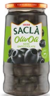
OLIVE NERE SNOCCIOLATE SENZA LIQUIDO