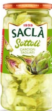
CARCIOFI TAGLIATI MAXI FORMATO