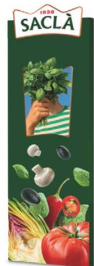
TOTEM COD. D071051

Larghezza 0,84 m Lunghezza 0,95 m Altezza 3,00 m