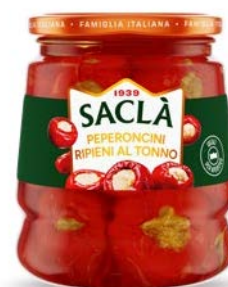
PEPERONCINI RIPIENI AL TONNO