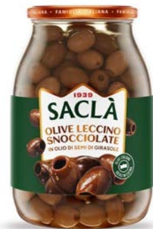
OLIVE LECCINO SNOCCIOLATE IN OLIO