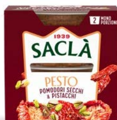
PESTO POMODORI SECCHI E PISTACCHI 2XME