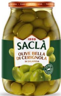
OLIVE BELLA DI CERIGNOLA