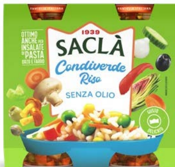
SENZA OLIO DUO