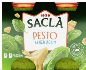
PESTO ALLA GENOVESE SENZA AGLIO DUO