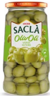
OLIVE VERDI INTERE