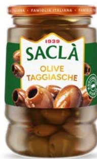
OLIVE TAGGIASCHE SNOCCIOLATE IN OLIO EXTRA VERGINE DI OLIVA