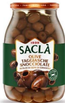
OLIVE TAGGIASCHE SNOCCIOLATE IN OLIO