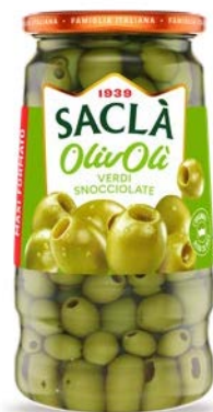
OLIVE VERDI SNOCCIOLATE