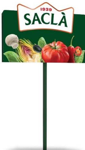
PIANTANA COD. DREBNO0700004

Larghezza 0,50 m Lunghezza 0,10 m Altezza 1,70 m