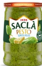
PESTO ALLA GENOVESE SENZA AGLIO