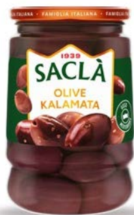
OLIVE KALAMATA INTERE IN SALAMOIA